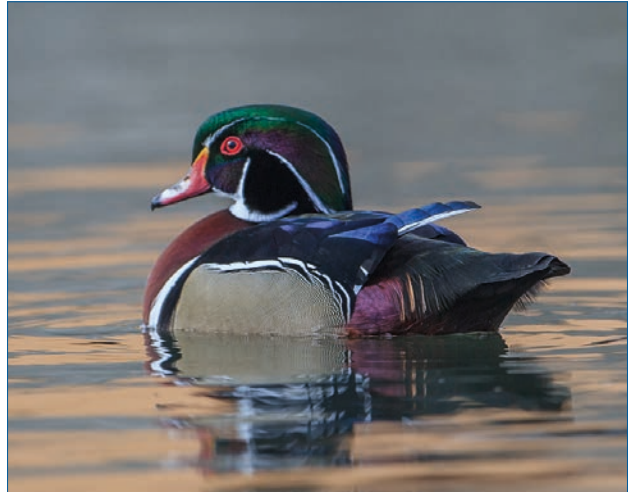
Brauterpel im Prachtkleid auf einem der Stadtteiche in Köthen, 20.03.2010.