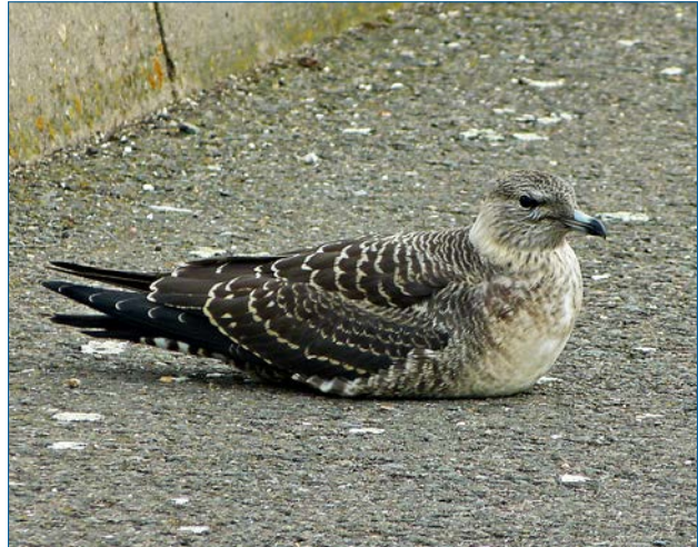
Falkenraubmöwe im 1. Kalenderjahr am Helmstausee/MSH, 26.08.2012.