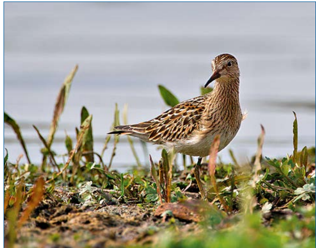
Diesjähriger Graubrust-Strandläufer in der Grube Amsdorf/MSH, 21.09.2012.

Phänologie des Auftretens des Graubrust-Strandläufers in Sachsen-Anhalt (n = 21 Ind.). Bei Vögeln mit längerem Aufenthalt wurde das Datum der Erstbeobachtung gewertet.