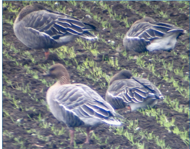
Kurzschnabelgans unter Tundrasaatgänsen nordwestlich von Wegeleben/HZ, 21.11.2014.

Aus dem Zeitraum von 1924 bis 2014 liegen insgesamt 189 Beobachtungen mit mind. 507 Ind. aus 41 Jahren vor, davon ab 1991 Nachweise von mind. 353 Ind. aus 19 Jahren. Die Zunahme der Beobachtungen nach dem Jahr 2000 erreichte mit 61 Ind. im Jahr 2014 ihren Höhepunkt. Auffallend ist insoweit eine deutliche Zunahme der Beobachtungen nach dem Wegfall der Meldepflicht im Jahr 2011. Aktuell werden durchschnittlich 12 Ind. pro Jahr nachgewiesen. Aus den 189 Beobachtungen ergaben sich folgende Trupppgrößen: 95 x 1, 41 x 2, 19 x 3, 11 x 4, 6 x 5, 3 x 6, 3 x 7, 4 x 8 und je 1 x 11, 12, 14, 25, 27 und 38 Ind.