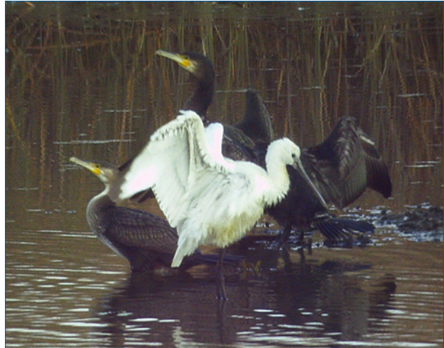
Löffler im Jugendkleid am 02.10.2014 am Wrechow in der Aland-Elbe-Niederung/SDL.