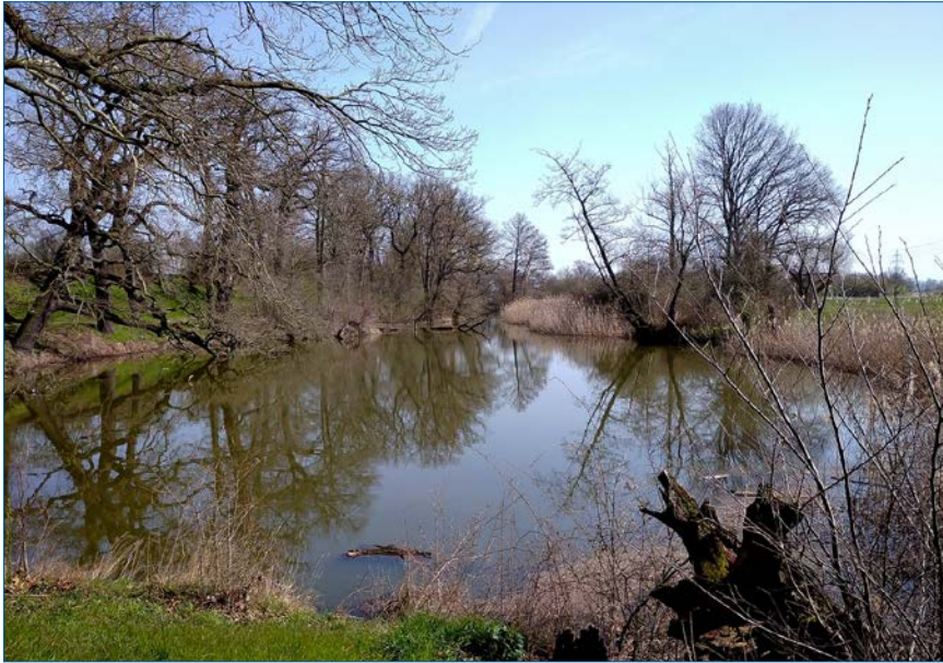
Lebensraum der Mandarinente am Krägen bei Wörlitz/WB, 29.03.2020.