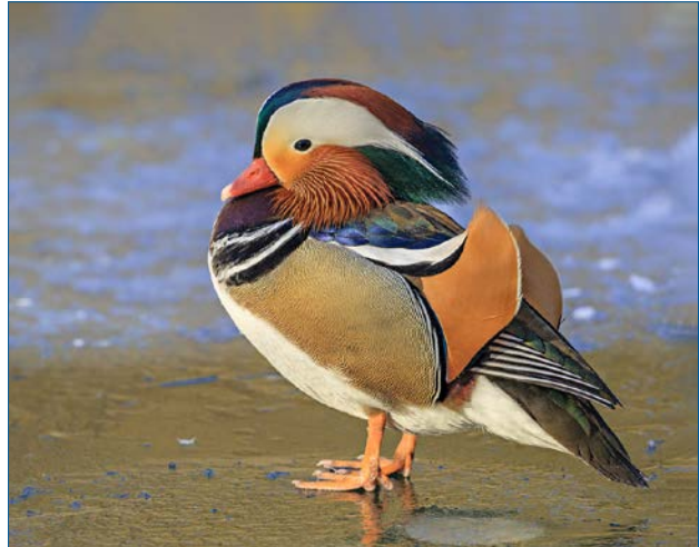
Männchen der Mandarinente im Prachtkleid auf dem Hubertusteich in Köthen/ABI, 09.03.2010.

In ihrer ostasiatischen Heimat bewohnen Mandarinenten im Bereich der Laubwalddaiga oligotrophe Seen und Tümpel sowie die Mittelläufe der Flüsse, in Japan auch Stadt- und Parkgewässer. In Sachsen-Anhalt werden vornehmlich von Altbaumbeständen umgebene Parkteiche und solche in den Randzonen urbaner Bereiche besiedelt. Im Falle der Bildung einer Eisdecke