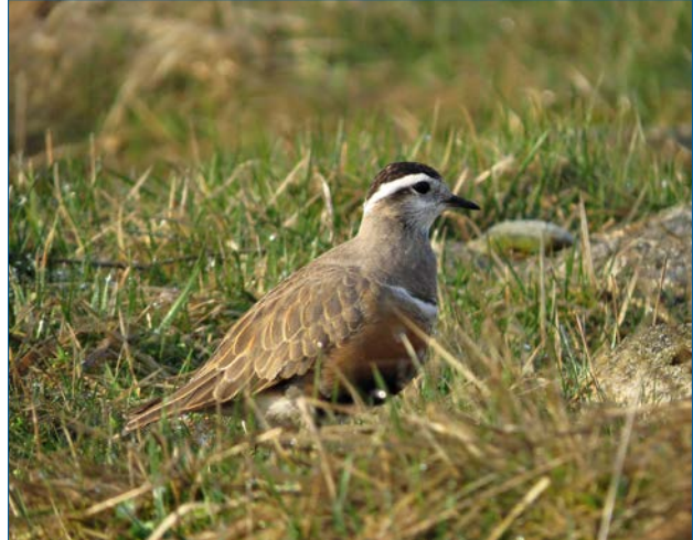
Adultes Weibchen des Mornellregenpfeifers am 23.04.2014 auf dem Brocken/HZ.