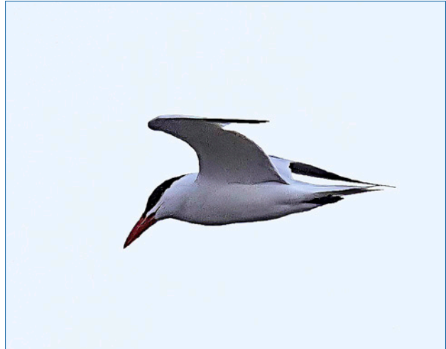
Raubseeschwalbe am Neustädter See/MD, 05.04.2015.