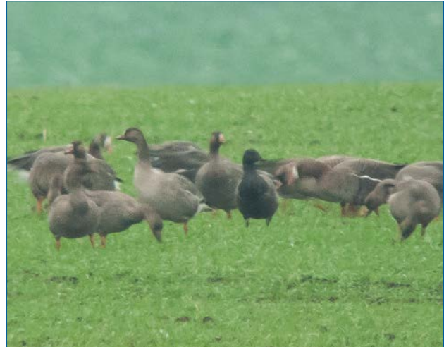
Diesjährige Dunkelbäuchige Ringelgans ( B. b. bernicla) unter Bläss- und Tundrasaatgänsen bei Gröbzig/ABI, 29.11.2013.