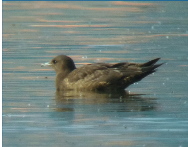
Schmarotzerraubmöwe im 1. Kalenderjahr am Helgestausee/MSH, 28.08.2014.