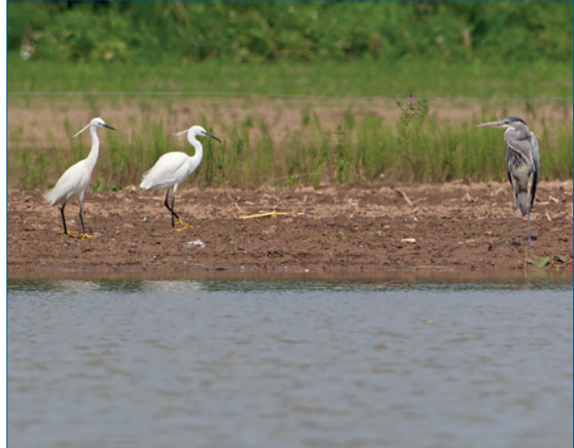
Zwei adulte Seidenreihler mit Graureihler am 09.07.2013 bei Hohenweiden/SK.