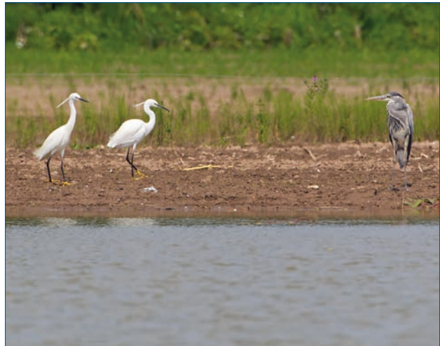
Zwei adulte Seidenreiher mit Graureiher am 09.07.2013 bei Hohenweiden/SK.