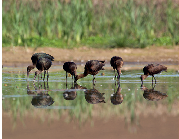
Gruppe von drei adulten und vier diesjährigen Sichlern am 29.09.2013 an einer überfluteten Ackersenke bei Raßnitz/SK.