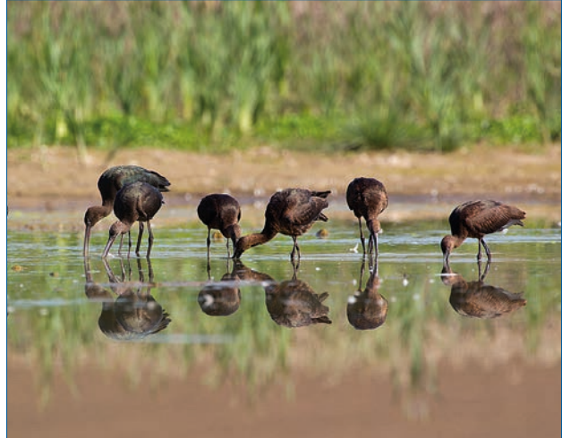
Gruppe von drei adulten und vier diesjährigen Sichlern am 29.09.2013 an einer überfluteten Ackersenke bei Raßnitz/SK.