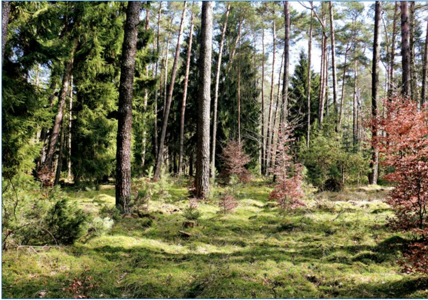
Bruthabitat des Sperlingskauzes im Fläming, Forstrevier Nedlitz/ABI, 15.05.2015.