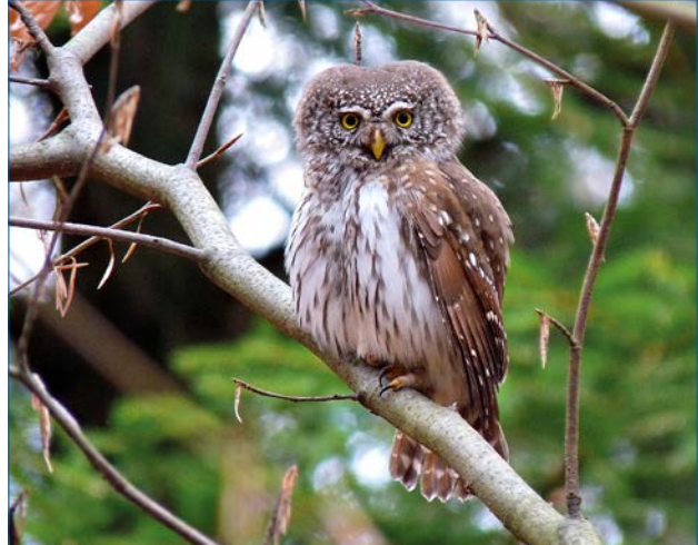
Sperlingskauz-Männchen in starker Erregung, Forstrevier Nedlitz/ABI, 25.03.2011.