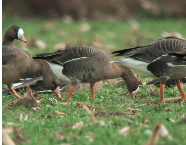
Adulte Zwerggans zwischen Blässgänsen bei Pömmelte/SLK, 21.03.2014.